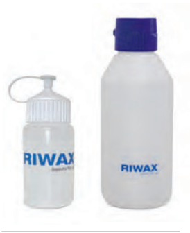
MŰANYAG FLAKON 250 / 500 ML