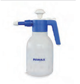
SPRAY-MATIC 1,25 L