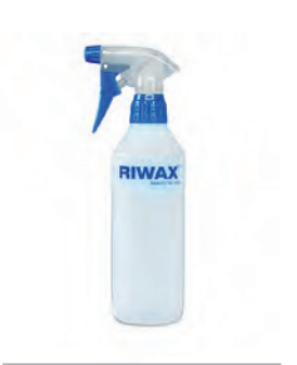
MINI SPRAYER 500 ML